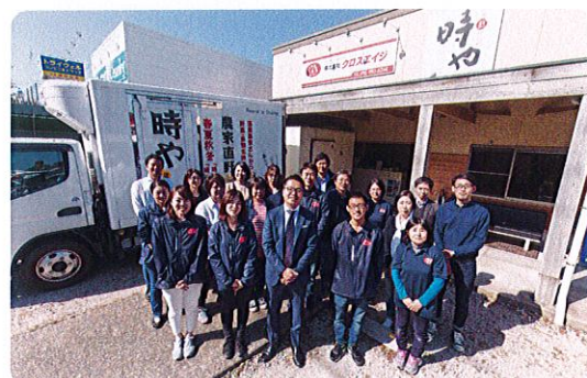
本社 福岡県春日市春日公園3-61-2