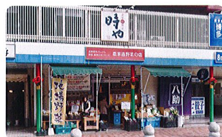
農家「直」野菜『時や』高宮店 福岡市南区大楠3-20-18 西鉄高宮駅名店街

農家こだわりの商品を対面販売で生活者に直接伝える場であり、また新商品のテスト販売や、生活者モニタリング実施の場でもあります。ぜひ一度お立ち寄り下さい。